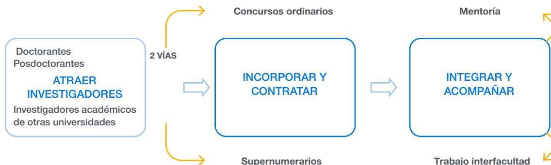
FIGURA 2. MODELO PROPUESTO PARA LA INICIATIVA ESTRATÉGICA "INSERCIÓN ACADÉMICA"